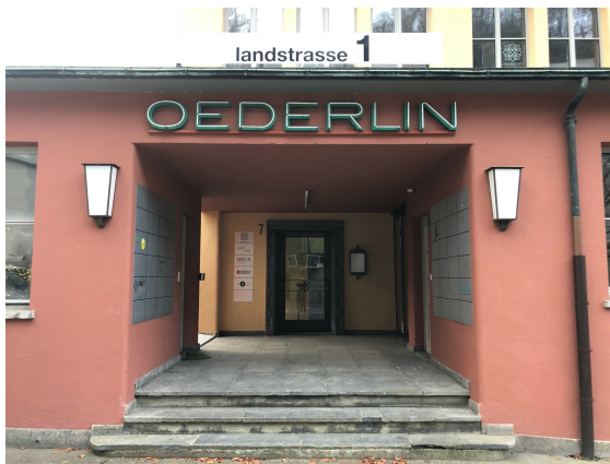
Eingangstüre Nr. 7 im Haus 'gelb'