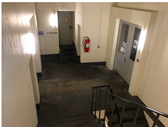
rechts durch die Brandschutztüre