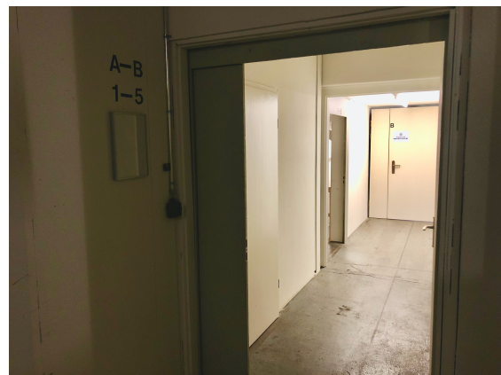
Nach der Brandschutztüre gleich wieder rechts ins Atelier 'B' wie 'balanced Pilates Studio'