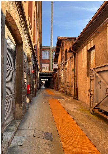
...durch den offenen Flur