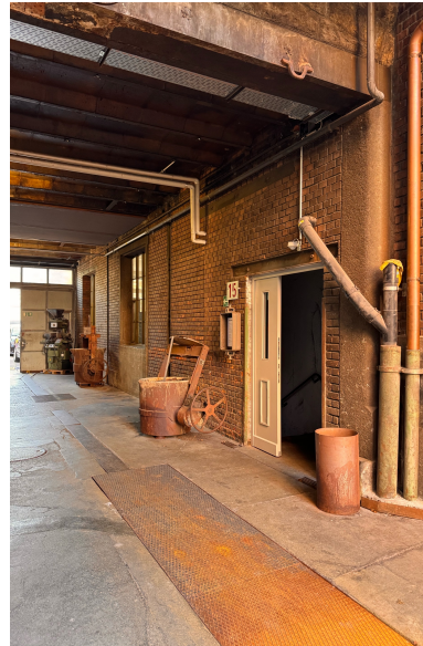
...bis der Durchgang wieder überdacht ist und auf der rechten Seite die erste (und einzige) Türe [15] kommt. Durch diese Türe und ...