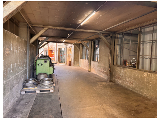
Durch diesen Durchgang gehst du...