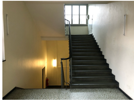
3 Treppen runter bis ins EG