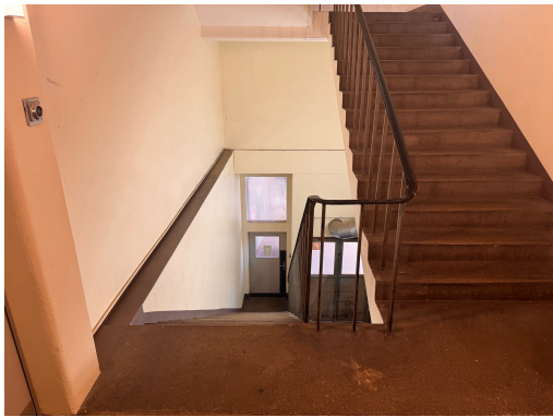
Ganz unten angekommen gehst du durch die Türe und dann links